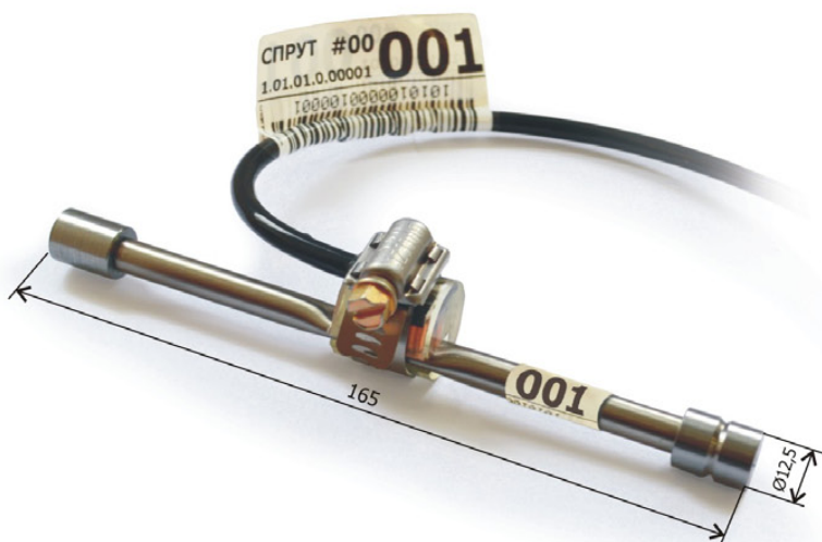
Концевой блок для монтажа